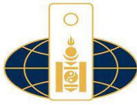
Монгол Улсын Гадаад харилцааны яам