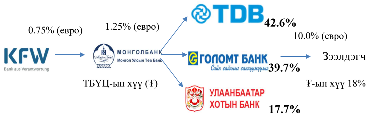
Зураг 2: КфВ төслийн зээлийн эргэлтийн сангийн эх үүсвэрийн хуваарилалт

Банкуудын ААН-д олгосон зээл: КфВ банкны төсөл манай улсад хэрэгжиж эхэлснээс хойш уг төсөлд нийт 158 ЖДҮ зээлд хамрагдаж, 66.1 тэрбум төгрөгийн хөнгөлөлттэй нөхцөлтэй зээл авсан байна. Тайлант улирлын эцсийн байдлаар 68 ЖДҮ эрхлэгч ААН-үүд 14.5 тэрбум төгрөг /5.46 сая евро/-ийн зээлийн үлдэгдэлтэй байна. Нэг зээлдэгчид ногдож буй дундаж зээлийн хэмжээ 213.7 сая төгрөг байна (Хүснэгт 2).