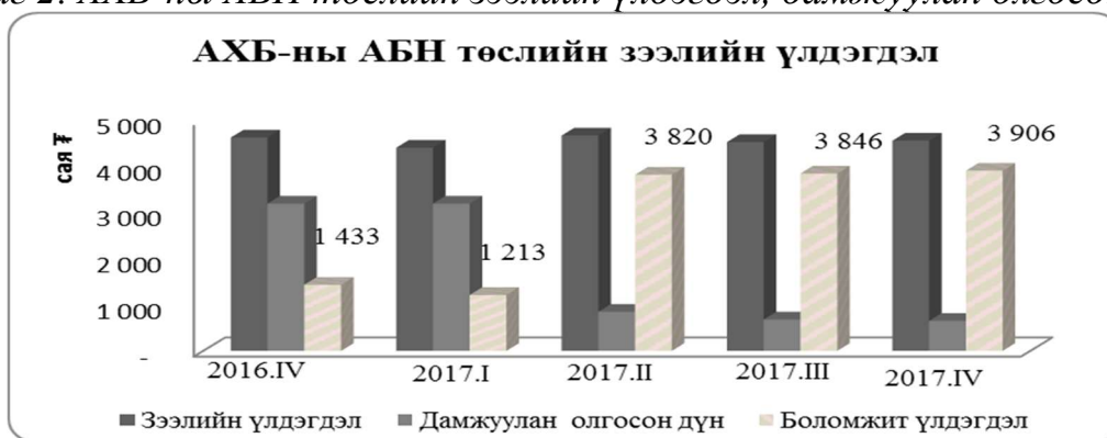
Зураг 2. АХБ-ны АБН төслийн зээлийн үлдэгдэл, дамжуулан олгосон дүн

Банкуудын тайлангаас үзэхэд 2017 оны 4 дүгээр улирлын байдлаар зээлийн үлдэгдэлтэй байгаа 26 аж ахуй нэгж нийт 78 ажлын байр бий болгосон байна.