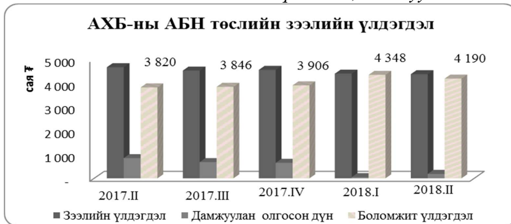
Зураг 2. АХБ-ны АБН төслийн зээлийн үлдэгдэл, дамжуулан олгосон дүн

Монголбанк төслийн үр өгөөжийг дээшлүүлэх зорилгоор төслийн нөхцөлийг өөрчлөх эсэх асуудлыг судалж байх хугацаанд Улаанбаатар хотын банк, Голомт банкуудад зээлийн эх үүсвэр олгохоо түр зогсоогоод байсан. Төслийн зээлийн нөхцөлд өөрчлөлт оруулах шаардлагагүй гэж үзсэн тул 2018 оны 3 дугаар улирлаас эхлэн эх үүсвэрийг холбогдох журмын дагуу үргэлжлүүлэн олгож байна.