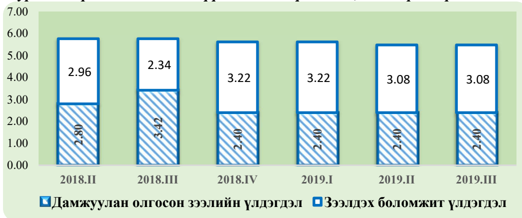
Зураг 1. КфВ төслийн санхүүжилтийн үлдэгдэл, сая еврогоор

Банкуудын ААН-д олгосон зээл: КфВ банкны төсөл манай улсад хэрэгжиж эхэлснээс хойш уг төсөлд нийт 171 ЖДҮ зээлд хамрагдаж, 84.2 тэрбум төгрөг*-ийн хөнгөлөлттэй нөхцөлтэй зээл авсан байна. Тайлант улирлын эцсийн байдлаар 44 ЖДҮ эрхлэгч ААН-үүд 7.0 тэрбум төгрөгийн зээлийн үлдэгдэлтэй байна. Нэг зээлдэгчид ногдож буй зээлийн дундаж хэмжээ 159 сая төгрөг байна.