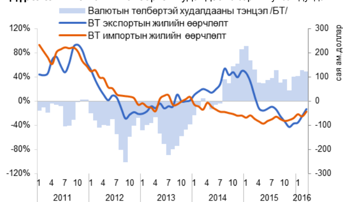
Дүрслэл 2. Худалдааны тэнцэл, голлох түнш орнуудаар