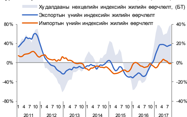
Зураг 3. Худалдааны нөхцөлийн индекс /3 сарын гулсах дундаж/

Гадаад худалдааны нөхцөлийн индекс тайлант хугацааны эцэст өмнөх оны мөн үеэс 40%-иар өссөн бол, өмнөх сараас 2%-иар буурч 1.68-д хүрлээ. Тайлант сард хөрөнгө оруулалт болон хэрэглээний барааны импортын үнэ өссөнөөс голлон шалтгаалж худалдааны нөхцөл өмнөх сараас муудсан.