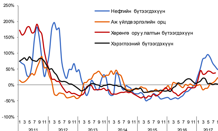
Зураг 5. Импортын бүтээгдэхүүний жилийн өсөлт /3 сарын гулсах дундаж/

2017 оны эхний 9 сарын гүйцэтгэлээр импорт нь тоо хэмжээний өөрчлөлтөөс шалтгаалаж 666.4 сая ам.доллараар өссөн бол үнийн өөрчлөлтөөс шалтгаалж 16.4 сая ам.доллараар тус тус өсчээ. Хэрэглээний бүтээгдэхүүний импорт нь тоо хэмжээ нэмэгдсэнээс шалтгаалж 70.4 сая ам.доллараар өсчээ. Хөрөнгө оруулалтын бүтээгдэхүүний импорт 42%-иар өссөн нь уг бүлгийн импортын тоо хэмжээний өөрчлөлтөөс шалтгаалсан байна.