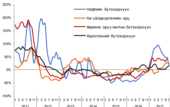
Зураг 5. Импортын бүтээгдэхүүний жилийн өсөлт /3 сарын гулсах дундаж/

2017 оны эхний 11 сарын гүйцэтгэлээр импорт нь тоо хэмжээний өөрчлөлтөөс шалтгаалаж 737 сая ам.доллараар, үнийн өөрчлөлтөөс шалтгаалж 88 сая ам.доллараар тус тус өсчээ. Хэрэглээний бүтээгдэхүүний импорт нь тоо хэмжээ нэмэгдсэнээс шалтгаалж 102 сая ам.доллараар өсчээ. Хөрөнгө оруулалтын бүтээгдэхүүний импорт 40%-иар өссөн нь уг бүлгийн импортын тоо хэмжээний өөрчлөлтөөс шалтгаалсан байна.