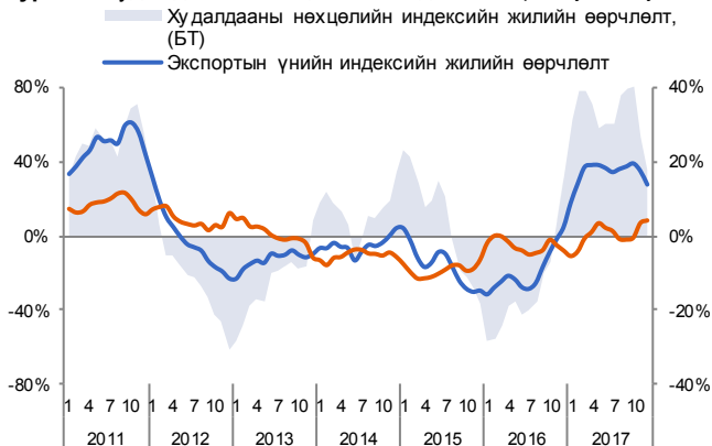
Зураг 3. Худалдааны нөхцөлийн индекс /3 сарын гулсах дундаж/

Гадаад худалдааны нөхцөлийн индекс 12 дугаар сард өмнөх оны мөн үеэс 15%-иар өссөн, өмнөх сараас 6%-иар тус тус өсөн 1.75-д хүрлээ. Тайлант сард зэс, нүүрс болон ямааны угаасан ноолуурын экспортын үнэ өссөнөөр худалдааны нөхцөл өмнөх сараас сайжирлаа.