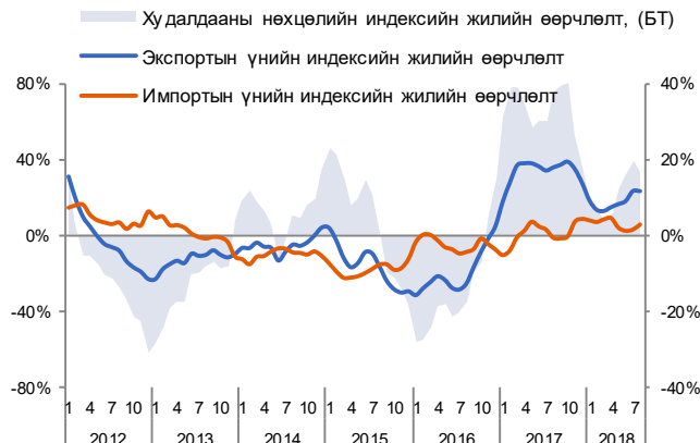
Зураг 3. Худалдааны нөхцөлийн индекс /3 сарын гулсах дундаж/

Гадаад худалдааны нөхцөлийн индекс 8 дугаар сард өмнөх оны мөн үеэс 10%-иар өссөн хэдий ч өмнөх сараас 4%-иар буурч 1.883-д хүрлээ. Худалдааны нөхцөл өмнөх сараас муудахад тайлант сард зэсийн баяжмал, чулуун нүүрсний экспортын үнийн бууралт голлон нөлөөлөв.