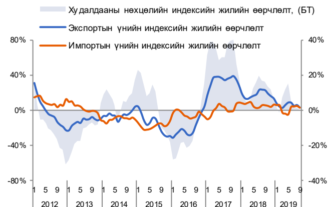
Зураг 3. Худалдааны нөхцөлийн индекс /3 сарын гулсах дундаж/

Гадаад худалдааны нөхцөлийн индекс 2019 оны 9 дүгээр сард өмнөх оны мөн үеэс 8%-иар, өмнөх сараас 10%-иар буурч 1.807-д хүрлээ. Худалдааны нөхцлийн индекс өмнөх сараас муудахад чулуун нүүрсний экспортын үнийн бууралт голлон тайлбарлагдаж байна.