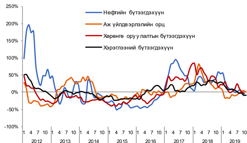
Зураг 5. Импортын бүтээгдэхүүний жилийн өсөлт /3 сарын гулсах дундаж/

2019 оны эхний 11 сарын гүйцэтгэлээр хөрөнгө оруулалтын бүтээгдэхүүний импорт 211 сая ам.доллараар, нефтийн бүтээгдэхүүний импорт 43 сая ам.доллараар, хэрэглээний бүтээгдэхүүний импорт 11 сая ам.доллараар тус тус өссөн бол аж үйлдвэрлэлийн орц бүтээгдэхүүний импорт 52 сая ам.доллараар буурснаар нийт импорт 212 сая ам.доллараар өслөө.