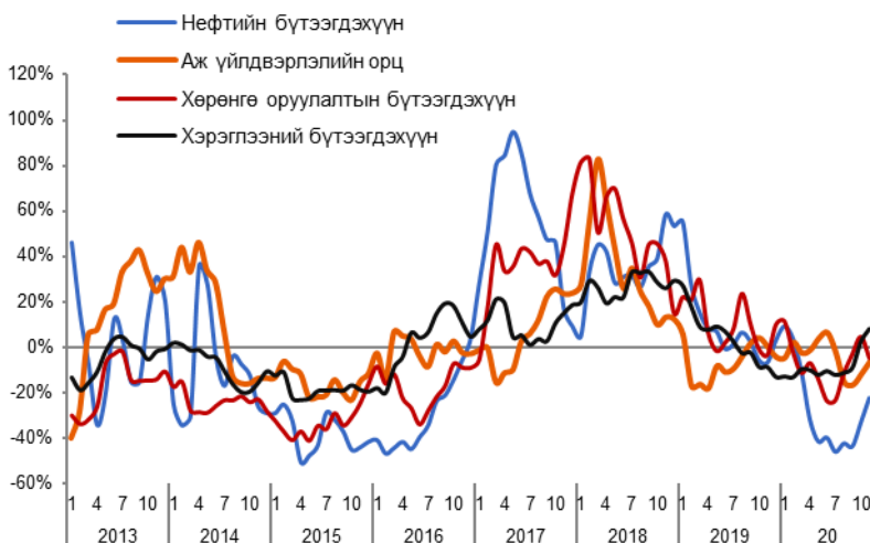
Зураг 5. Импортын бүтээгдэхүүний жилийн өсөлт /3 сарын гулсах дундаж/

2020 оны эхний 11 сарын гүйцэтгэлийг өмнөх оны мөн үетэй харьцуулбал, нийт импорт 697 сая ам.доллараар буурсан. Үүнд: