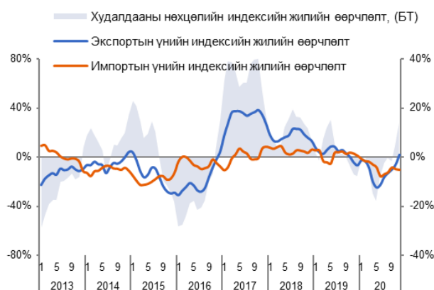
Зураг 3. Худалдааны нөхцөлийн индекс /3 сарын гулсах дундаж/

Худалдааны нөхцөлийн индекс өмнөх оны мөн үеэс өсөхөд зэсийн баяжмал, чулуун нүүрс болон алтны экспортын үнэ өссөнөөр тайлбарлагдаж байна. Харин өмнөх сараас өсөхөд зэс болон хэрэглээний барааны импортын үнийн өсөлтөөс голлон шалтгаалжээ.