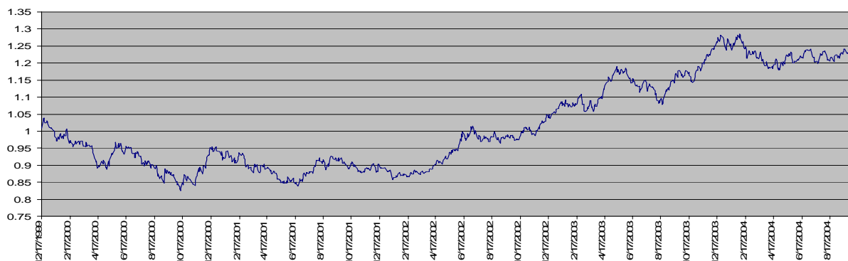
Зураг 1. Доллартай харьцах еврогийн ханш

Манай орны хувьд төгрөгтэй харьцах еврогийн ханшийг өөрсдийн зах зээл дээр тогтоодоггүй, харин дэлхийн зах зээл дээр тогтсон евротой харьцах ам. долларын ханшаар дамжуулан тогтоодог.