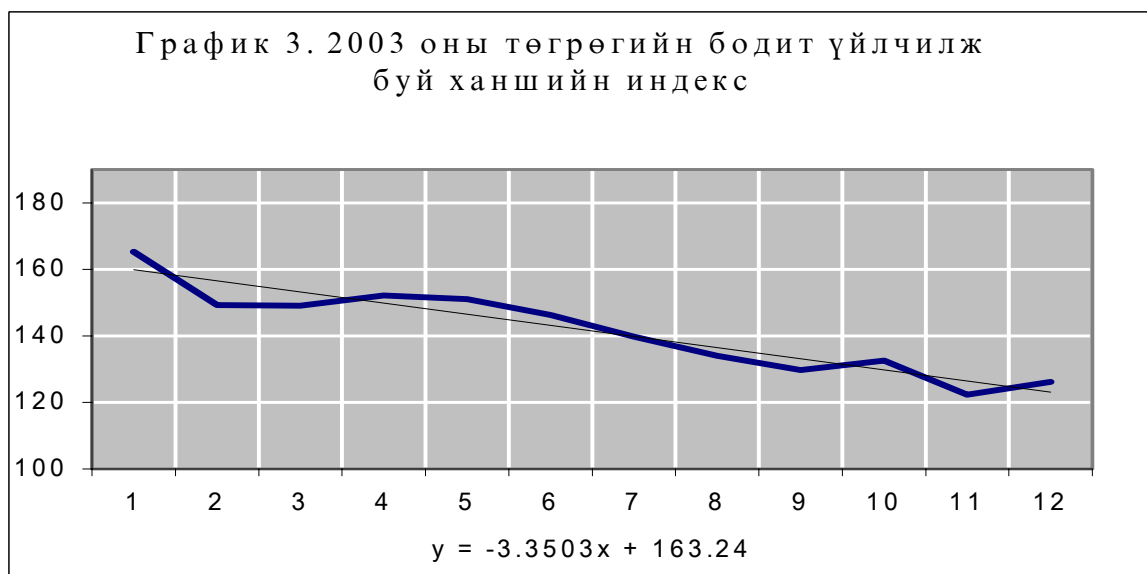
График 3-т бодит ханшийн трендийг үзүүлэв.

байгаа тул динамик эгнээ мөн буурах хандлагатай байна. Ийнхүү 2003 онд төгрөгийн нэрлэсэн болон бодит үйлчилж буй ханшийн аль аль нь суларч байсан нь нотлогдож байна.