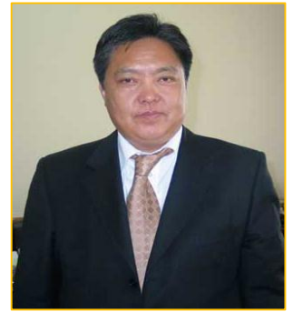
М.Энхсайхан Ерөнхий сайд асан

Эцэст нь хэлэхэд, шинээр санаачилж буй яамыг буруугаар эргүүлж худалдааны монополийг бий болгох эрсдэл бий. Мөн худалдаачин үндэстэн болохын тулд төр засаг, ард иргэд бүгд цогц мэдээлэлтэй болох хэрэгтэй.