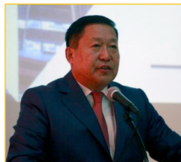
Н.Баяртсайхан Монголбанкны Ерөнхийлөгч

Монголчууд бид худалдаа, арилжаагаар амьжиргаагаа зохицуулан амьдарч байгаа атлаа тодорхой үр дүнд хүрсэн гадаад худалдааны цогц бодлогогүй, энэ асуудлыг дангаар хариуцсан яамгүй явж ирлээ.