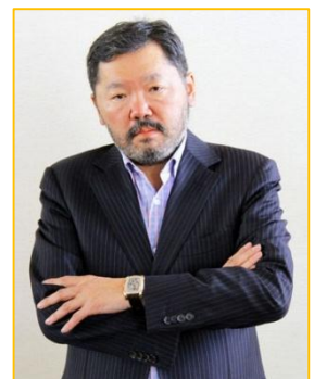
Ч.Амарбаатар Ерөнхийлөгч Барс групп

Монголчууд үйлдвэрлэл эрхлэхэд хэтэрхий ухаантай ард түмэн юм. Заавал аливаа зүйлийн арга эвийг олж, технологийг өөрчилдөг. Тэгэхээр бидэнд үйлдвэрлэл зохихгүй билээ. Мөн комерц гэдэг гадаад үгийг худалдаа гэж орчуулах нь учир дутагдалтай тул үүнийг зөв орчуулж, нэгдсэн ойлголтонд хүрэх шаардлага бий.