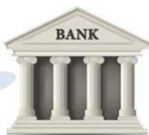
АРИЛЖААНЫ БАНКУУД (ШУУД ОРОЛЦОГЧ)