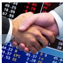
ИРГЭН, ХУУЛИЙН ЭТГЭЭД (ШУУД БУС ОРОЛЦОГЧ)