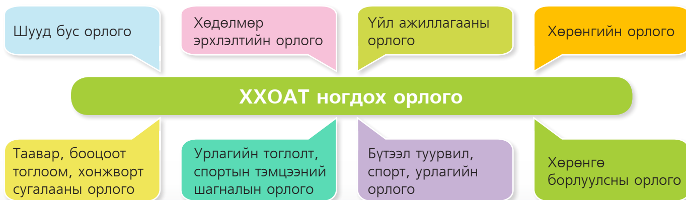
Зураг 2. ХХОАТ ногдох орлого

“Хувь хүний орлогын албан татварын тухай хууль”-д зааснаар хувь хүн олсон дараах орлогоосоо татвар төлнө. Өөрөөр хэлбэл, хувь хүний олсон орлогыг дараах байдлаар ангилдаг. Зураг 2-ыг харна уу.