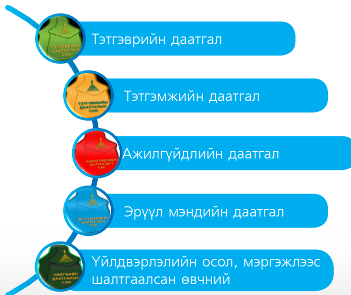
Зураг 1. Нийгмийн даатгалд даатгуулах хэлбэр

Тэтгэврийн даатгал бол нийгмийн даатгалын нэг төрөл юм. Нийгмийн даатгалыг төрөөс хэрэгжүүлдэг бөгөөд 5 төрлийн даатгалыг өөртөө багтаадаг.