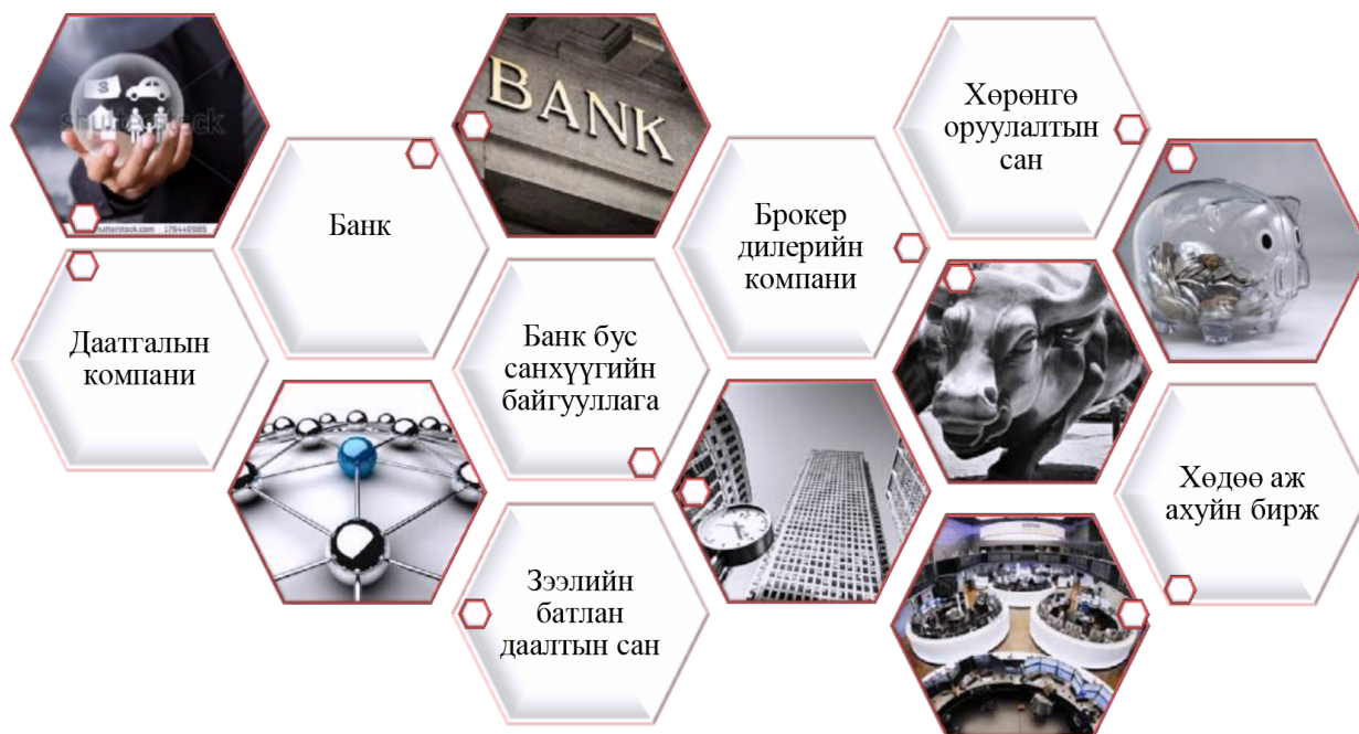
Зураг 1.1. Санхүүгийн байгууллагын төрөл

төлбөр тооцоо хийх, Монголбанк, Засгийн газрын бодлогыг хэрэгжүүлэхэд оролцох зэрэг олон талт үйл ажиллагаа явуулдаг.