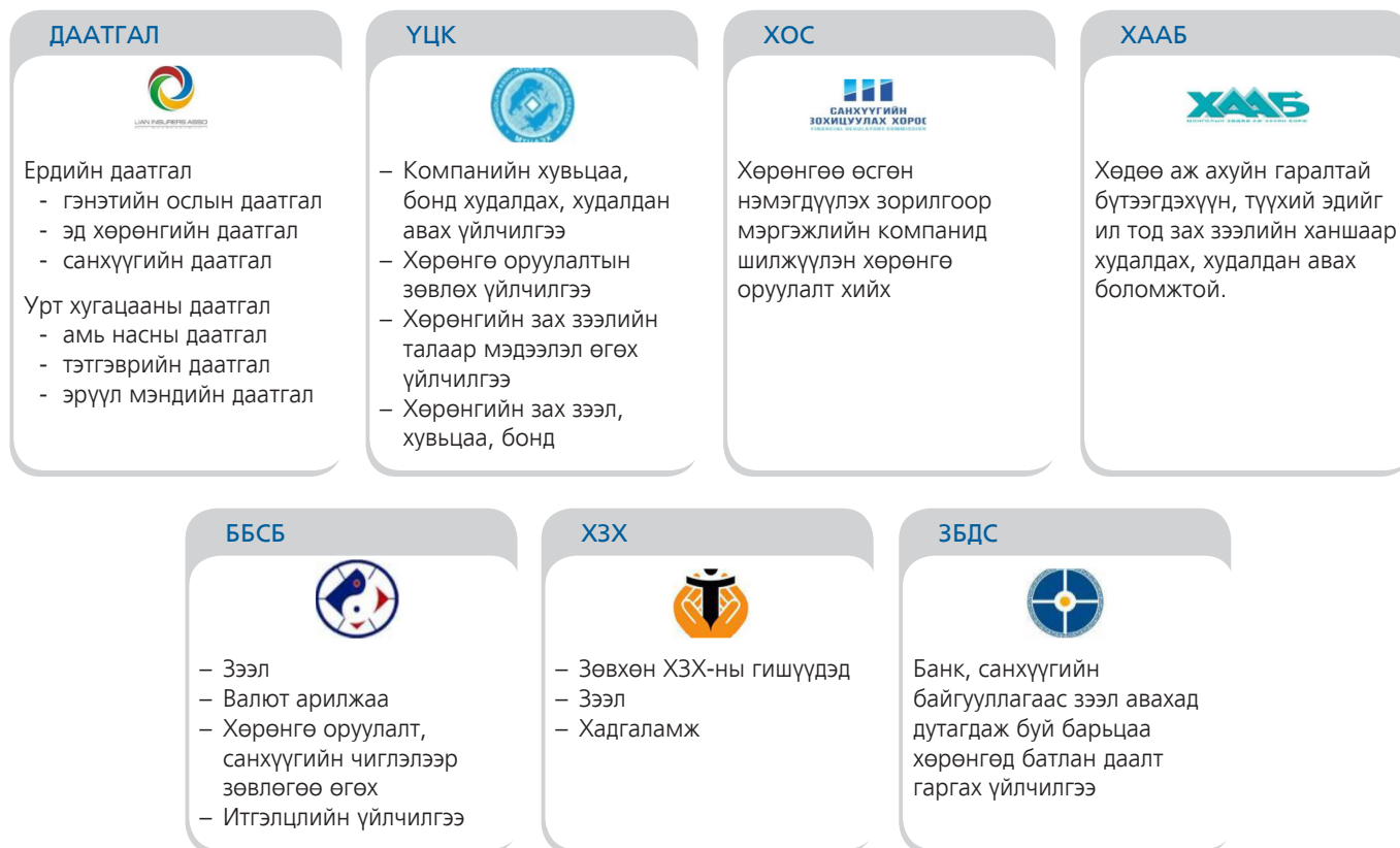
Хүснэгт 1.6. Санхүүгийн байгууллагын бүтээгдэхүүн, үйлчилгээ