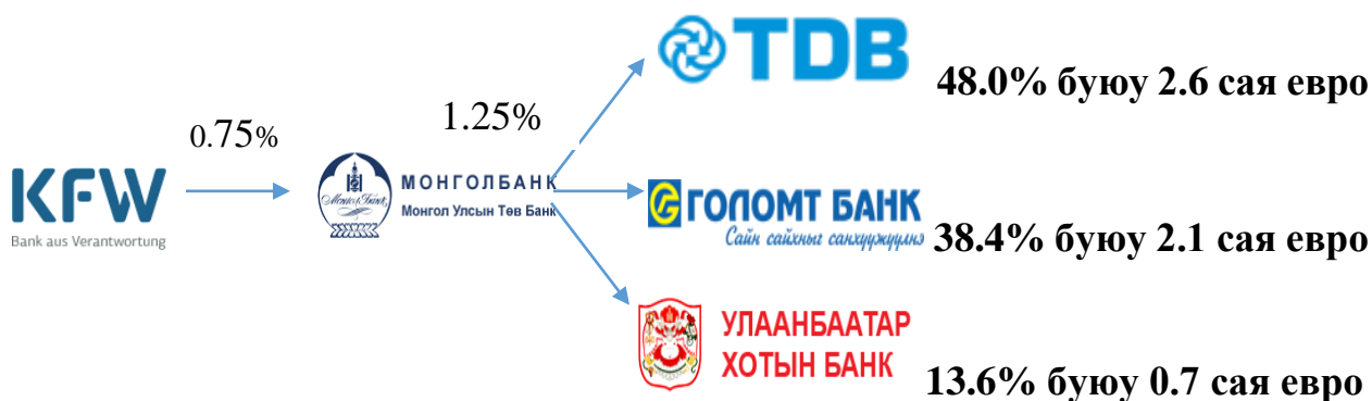
Зураг 2: КфВ төслийн зээлийн эргэлтийн сангийн эх үүсвэрийн хуваарилалт

Банкуудын ААН-д олгосон зээл: КфВ банкны төсөл манай улсад хэрэгжиж эхэлснээс хойш уг төсөлд нийт 149 ЖДҮ зээлд хамрагдаж, 63.9 тэрбум төгрөгийн хөнгөлөлттэй нөхцөлтэй зээл авсан байна. Тайлант улирлын эцсийн байдлаар 63 ЖДҮ эрхлэгч ААН-үүд 13.7 тэрбум төгрөгийн зээлийн үлдэгдэлтэй байна. Нэг зээлдэгчид ногдож буй дундаж зээлийн хэмжээ 218.1 сая төгрөг байна (Хүснэгт 2).