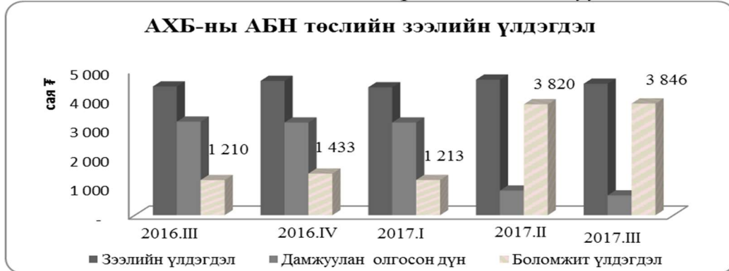
Зураг 2. АХБ-ны АБН төслийн зээлийн үлдэгдэл, дамжуулан олгосон дүн

Банкуудын тайлангаас үзэхэд 2017 оны 3 дугаар улирлын байдлаар зээлийн үлдэгдэлтэй байгаа 37 аж ахуй нэгж нийт 111 ажлын байр бий болгосон байна.