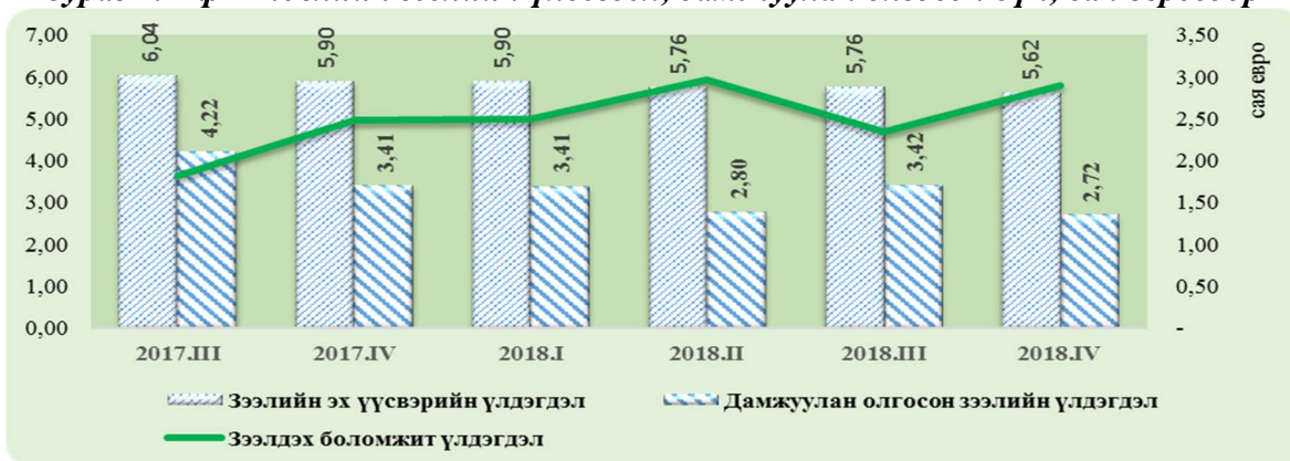
Зураг 1. КфВ төслийн зээлийн үлдэгдэл, дамжуулан олгосон дүн, сая еврогоор

Эх үүсвэрийн ашиглалт: Тайлант хугацааны эцсийн байдлаар хөтөлбөрийн эргэлтийн сангийн хөрөнгийн 48.5 хувийг дамжуулан олгосон байна. КфВ төслийн ашиглаагүй эх үүсвэрийн үлдэгдэл 2018 оны 4 дүгээр улирлын эцсийн байдлаар 2.89 сая евро буюу 8.75 тэрбум төгрөг* байна (Зураг1).