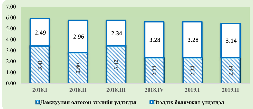
Зураг 1. КфВ төслийн зээлийн үлдэгдэл, дамжуулан олгосон дүн, сая еврогоор

Банкуудын ААН-д олгосон зээл: КфВ банкны төсөл манай улсад хэрэгжиж эхэлснээс хойш уг төсөлд нийт 171 ЖДҮ зээлд хамрагдаж, 86.2 тэрбум төгрөг*-ийн хөнгөлөлттэй нөхцөлтэй зээл авсан байна.